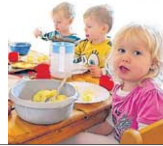
Eilenburg Kinderrestaurant wird eröffnet Seite 18