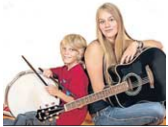
Delitzsch Musikalisches Geschwisterpaar rockt Seite 17