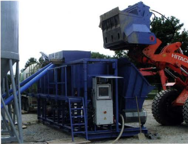
Einsatz der Dosiereinheit an der Kompaktanlage.