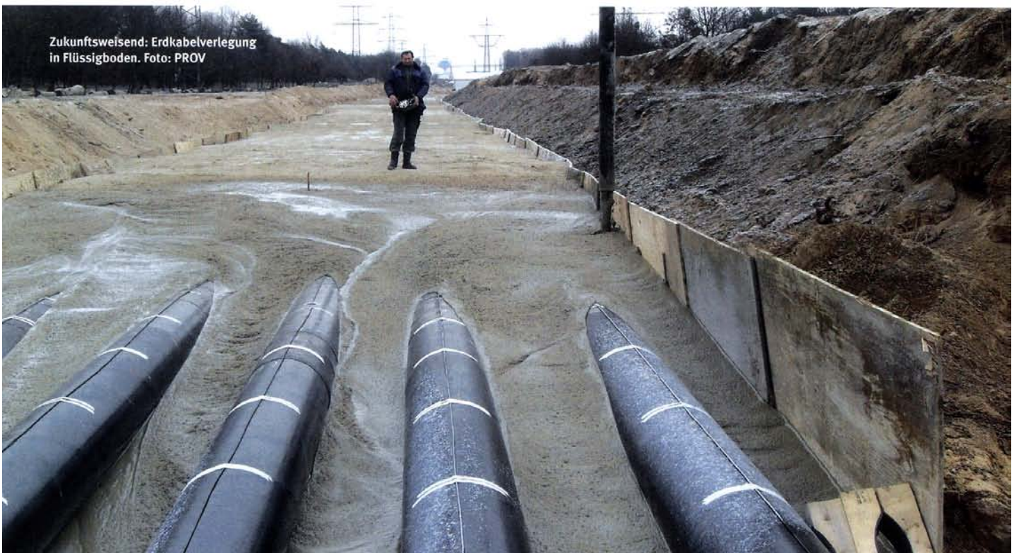
Zukunftsweisend: Erdkabelverlegung in Flüssigboden.

Die vorgenannten Eigenschaften kann Flüssigboden im Sinne des RAL Gütezeichen 507 durch seine besondere Funktionalität der seit weit über 10 Jahren bereits gezielt z. B. für Abdichtungen gegen Wasser bzw. als mineralische Kapselungen genutzten dauerhaft stabi-