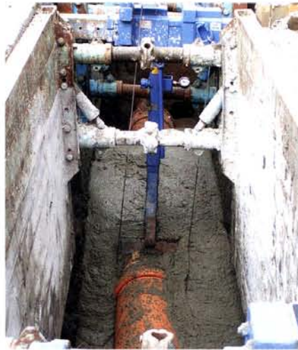
Der Einsatz von Rohrverlegehilfen dient zur Lage-sicherung und der Messung des Auftriebes.

Doch die bekannten Schaufelseparatoren zeigten noch eine andere Auffälligkeit. Die in ihnen verwendeten Schlägel wiesen oft einen sehr hohen Verschleiß auf und das selbst bei durchaus nicht stark abrasiven Böden. Auch standen infolge dieser Schlägeltechnik die Scheiben dieser Separatoren nicht im durchgehenden Eingriff mit dem verarbeiteten Material. Das ist aber aus speziellen Gründen für technologisch wichtige Eigenschaften des Flüssigbodens, wie