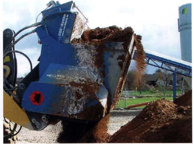
Die neuen Schaufelseparatoren lassen sich flexibel und wirtschaftlich einsetzen.

chern, den Prozess gut und auch entfernt von der Baustelle sicher zu steuern, zu dokumentieren und dabei die in Datenbanken und andere elektronisch verfügbare Hilfsmittel eingeflossenen Erfahrungen der Anwender und Entwickler entsprechend zu nutzen. Der Kunde kann viele Vorteile von Statistikfunktionen bis Lieferscheindruck und elektronische Weiterleitung für die Optimierung seiner Prozessabläufe aber auch für die Beschleunigung der Abrechnung der Baustelle nutzen. Sollten einmal Probleme auftreten, besteht die Möglichkeit der sofortigen web- oder funkbasierten Unterstützung durch die Hersteller. Auch die Fremdüberwachung ist auf Grundlage dieser Technik web-